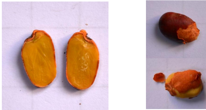
Gambar 3. Bagian dalam biji kayu kuku

Biji mirip kancing yang pinggirannya berlekuk. Ukuran biji kategori sedang dengan dimensi \pm 0,7 \times 1,6 \times 0,5 cm. Buah polong seberat satu kilogram dapat menghasilkan 320 gram biji, atau sebanyak 704 butir biji, sebanyak 15% tidak dapat dipilih untuk benih