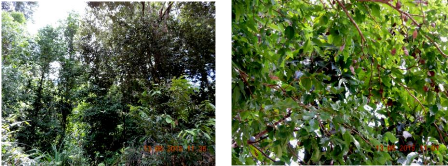
Gambar 1. Pohon kayu kuku sedang berbuah masak

Buah pohon kayu kuku tergolong buah kotak , mempunyai ruang biji atau kotak hingga empat ruang, yang paling umum, yaitu satu, dua dan tiga ruang biji, setiap ruang kotak hanya berisi satu biji. Morfologi buah bentuknya membulat pada pangkal dan meruncing pada ujungnya. Kulit buah terpecah jika masak, namun tidak terlepas dari tangkai buahnya. Warna buah ketika masak putih pucat atau kecokelatan . Kulit buah menebal dan keras pada pinggiran buah. Permukaannya bergelombang kecil, termasuk bentuk buah dehiscens . Kulit buah keras sehingga sulit dipecahkan, karena kulit buah mempunyai jaringan gabus yang tebal dalam membungkus biji. Bentuk buah masak serta biji pohon kayu kuku dapat dilihat pada Gambar 2.